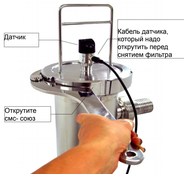
Рис.2 СМС- союз

Открутив провод от датчика, загрязненный фильтр надо удалить из внутренней части корпуса. Потом ключом (в составе) надо открутить смс-союз, обеспечивающий внутренний фильтр.