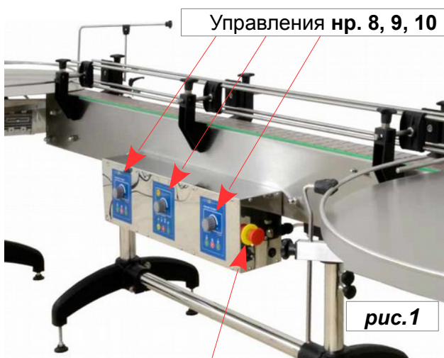
Аварийный выключатель нр.12