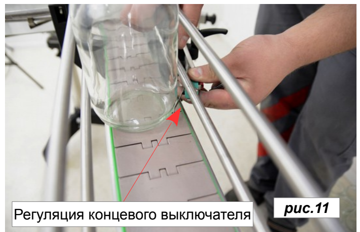
Регуляция концевой выключателя