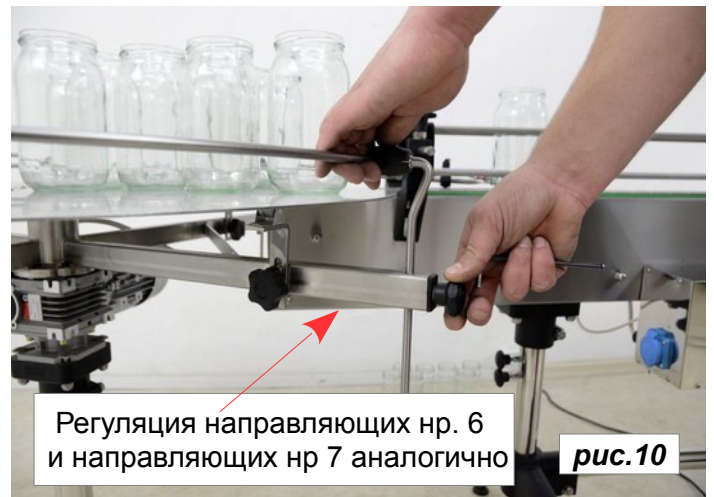
Регуляция направляющих нр. 6 и направляющих нр 7 аналогично