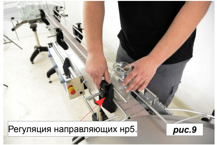
Регуляция направляющих нр5.