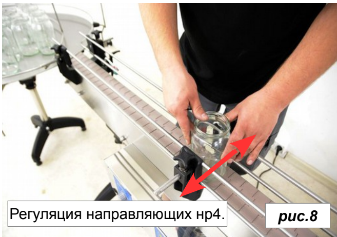
Регуляция направляющих нр4.

Установление концевой выключателя проверяем во время работы стола и ленточного транспортера. Каждая банка должна на момент остановиться на ленте.