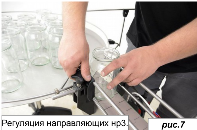
Регуляция направляющих нр3.